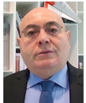
Sergio Clarelli Studio di ingegneria economica e ambientale