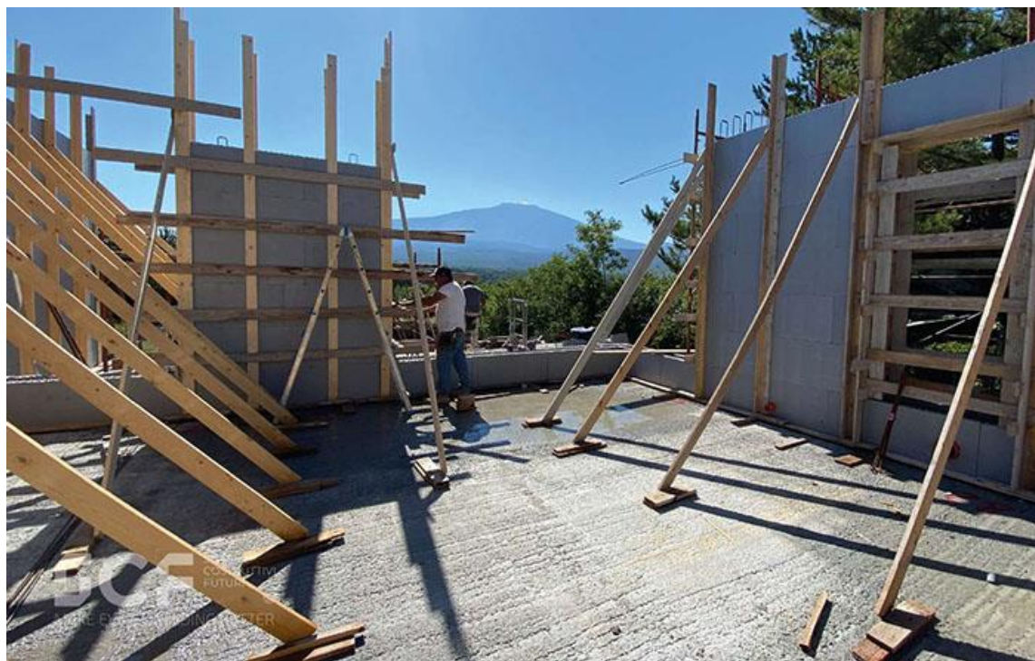
Figura 2: Fasi di montaggio del Sistema H2Wall® di SCF.

La riduzione dei costi legati alla realizzazione e alla gestione degli edifici, oltre ai benefici economici, ha implicazioni sotto l'aspetto ambientale ed è oggi il valore aggiunto che fa la differenza sia per i costruttori che per committenti e progettisti. L'impiego dell'EPS garantisce l'abbattimento dei consumi energetici sia nel periodo estivo sia nel periodo invernale ripercuotendosi positivamente sulle emissioni legate al riscaldamento/raffreddamento degli ambienti.