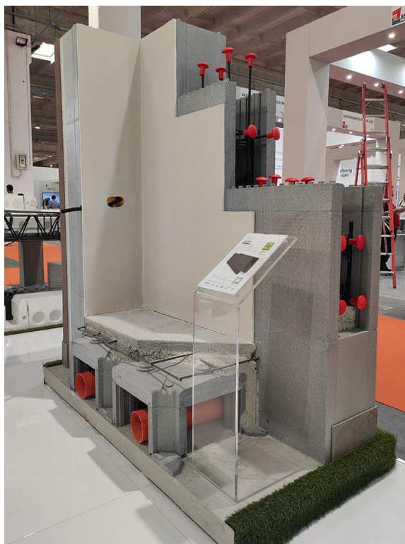
Figura 9: Dettaglio del Sistema H2Wall® di SCF.