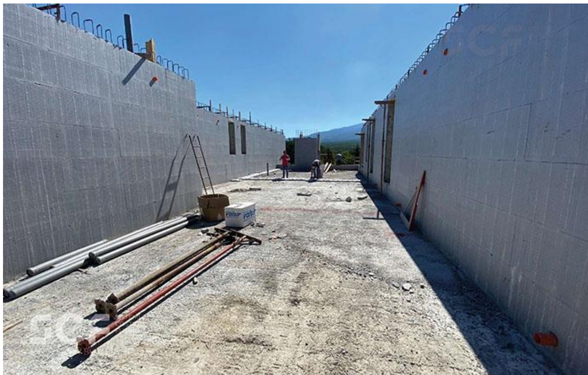
Figura 3: Fasi di montaggio del Sistema H2Wall® di SCF.

La riduzione dei costi legati alla realizzazione e alla gestione degli edifici, oltre ai benefici economici, ha implicazioni sotto l'aspetto ambientale ed è oggi il valore aggiunto che fa la differenza sia per i costruttori che per committenti e progettisti. L'impiego dell'EPS garantisce l'abbattimento dei consumi energetici sia nel periodo estivo sia nel periodo invernale ripercuotendosi positivamente sulle emissioni legate al riscaldamento/raffreddamento degli ambienti.