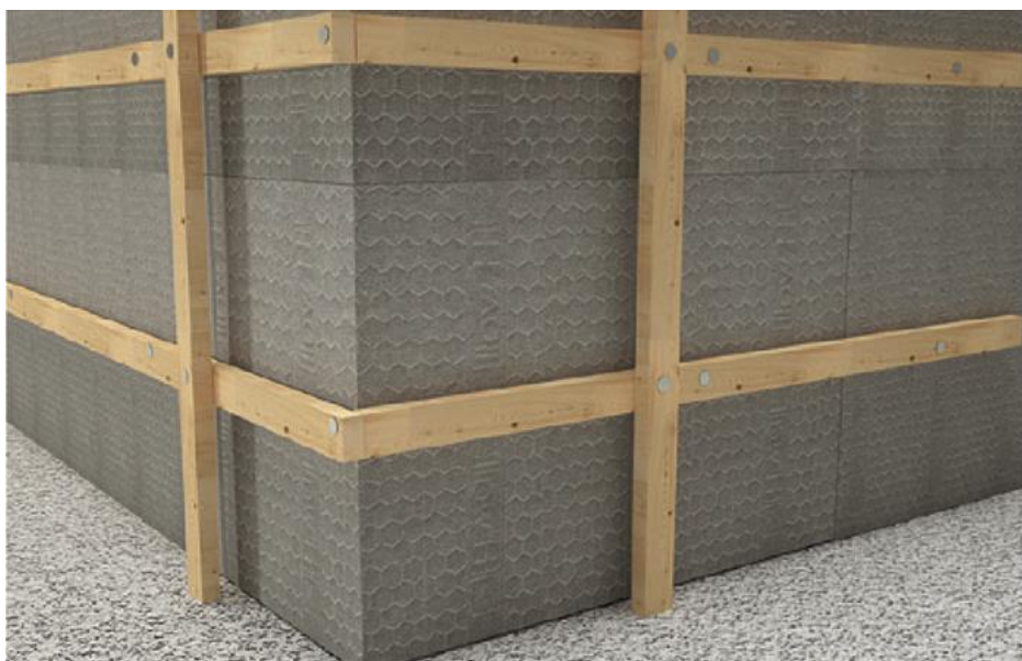
Figura 7: Fasi di montaggio del Sistema H2Wall® di SCF.

Grazie alle sue caratteristiche è possibile realizzare superfici senza soluzione di continuità che oltre ad annullare eventuali ponti termici non richiedono l'utilizzo di carpenteria lignea, a vantaggio dei tempi di realizzazione e dell'economicità dell'opera. Il design del sistema è stato opportunamente studiato per facilitare la posa in opera: ogni elemento può essere ribaltato/ruotato garantendo il perfetto accoppiamento e aggancio e riducendo gli sfridi di cantiere.