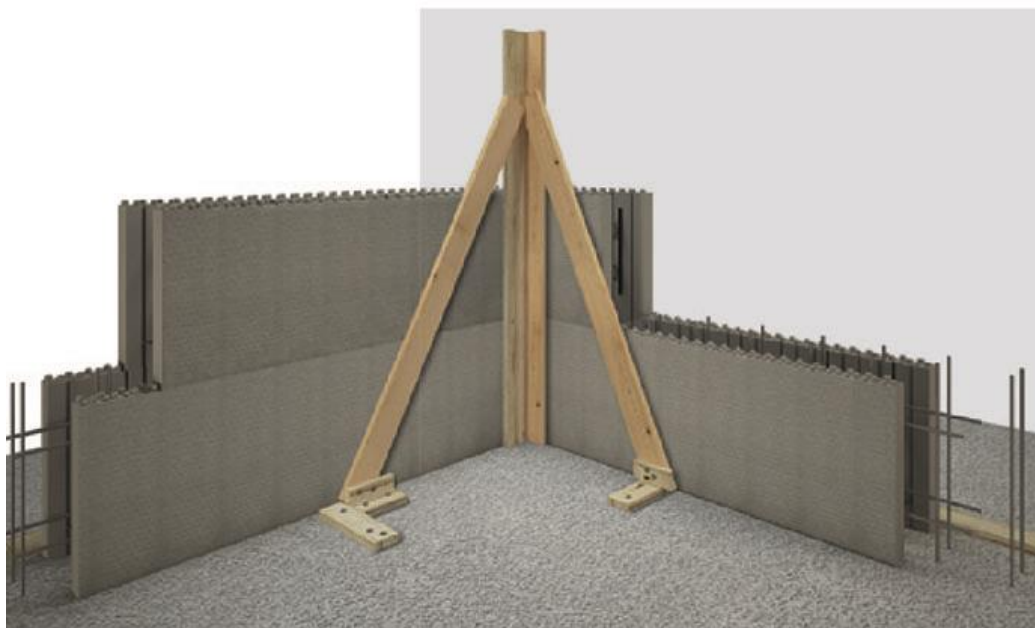
Figura 4: Fasi di montaggio del Sistema H2Wall® di SCF.

I materiali da costruzione scelti, infatti, svolgono un ruolo importante nel garantire la sostenibilità, la funzionalità, le prestazioni e l'estetica della struttura.