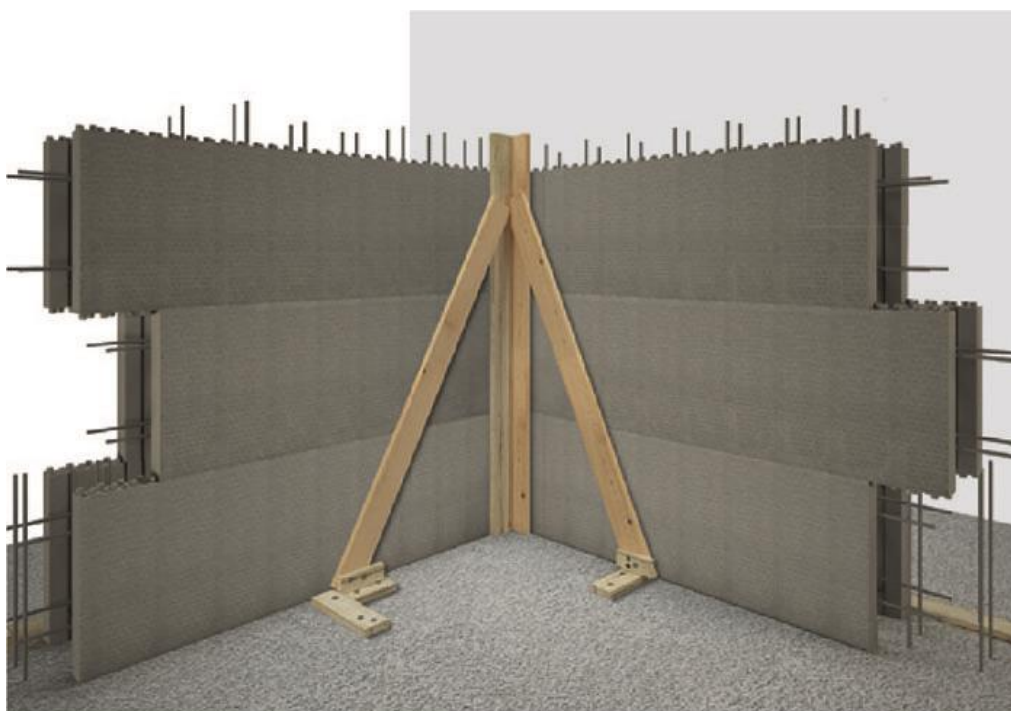
Figura 5: Fasi di montaggio del Sistema H2Wall® di SCF.