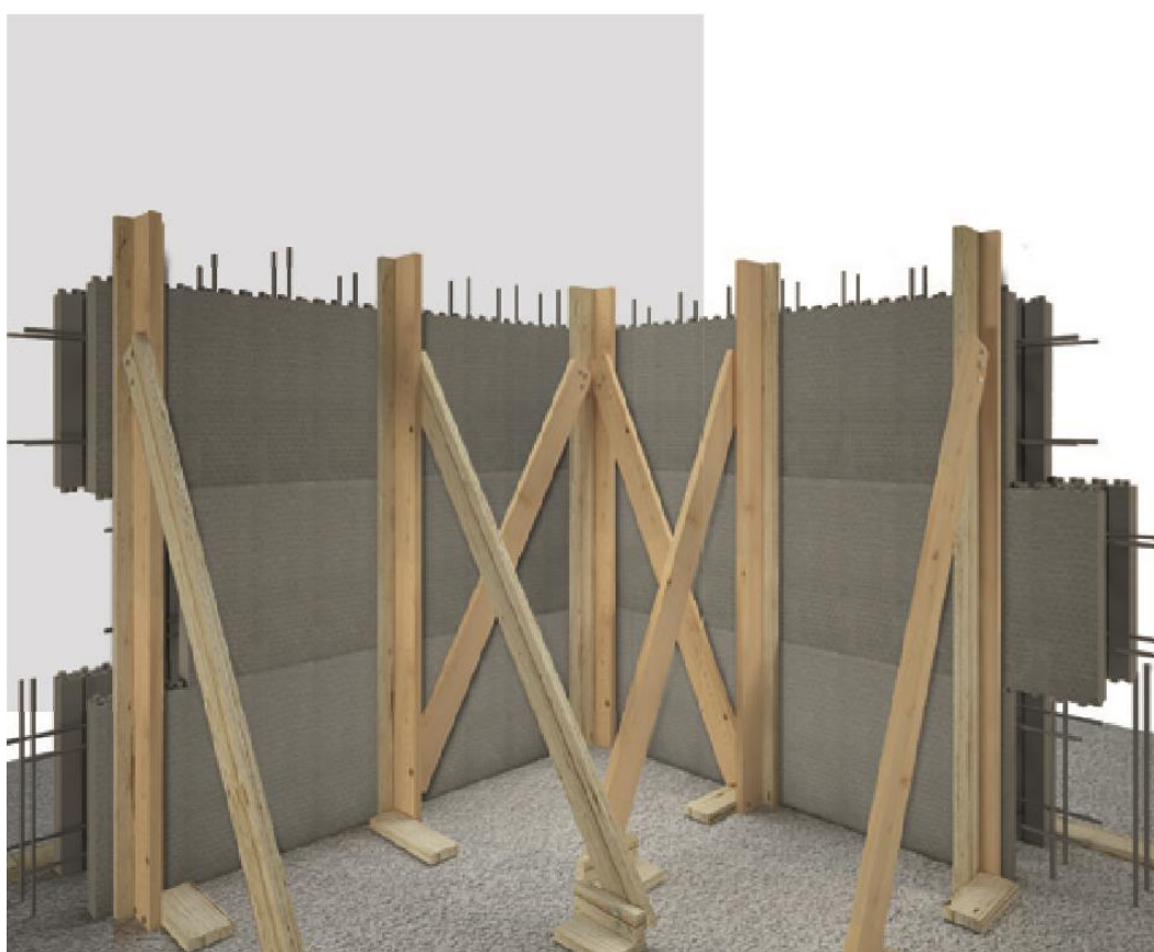
Figura 6: Fasi di montaggio del Sistema H2Wall® di SCF.

L'elemento cassero H2Wall® per sistemi ICF (Insulated Concrete Form) consente l'esecuzione di edifici sismo resistenti a pareti portanti con armatura diffusa. Il suo impiego si presta tanto all'edificazione di nuove costruzioni di Classe Energetica A, quanto alla realizzazione di contro pareti in c.a. coibentate con la funzione di consolidare muri dissestati o adeguare sismicamente vecchi fabbricati non vincolati dal punto di vista storico o artistico.