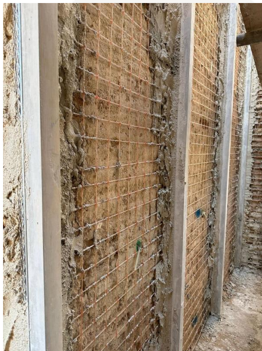
Sistema CRM della linea OLYMPUS STONE

I sistemi di rinforzo CRM della linea OLYMPUS STONE® sono costituiti da: reti preformate OLY MESH GLASS, angolari in rete preformati OLY MESH CORNER GLASS, elementi di connessione OLY ROD GLASS L, ancoranti chimici OLY RESIN I per la solidarizzazione dei connettori tra loro o l'ancoraggio degli stessi nel supporto murario.