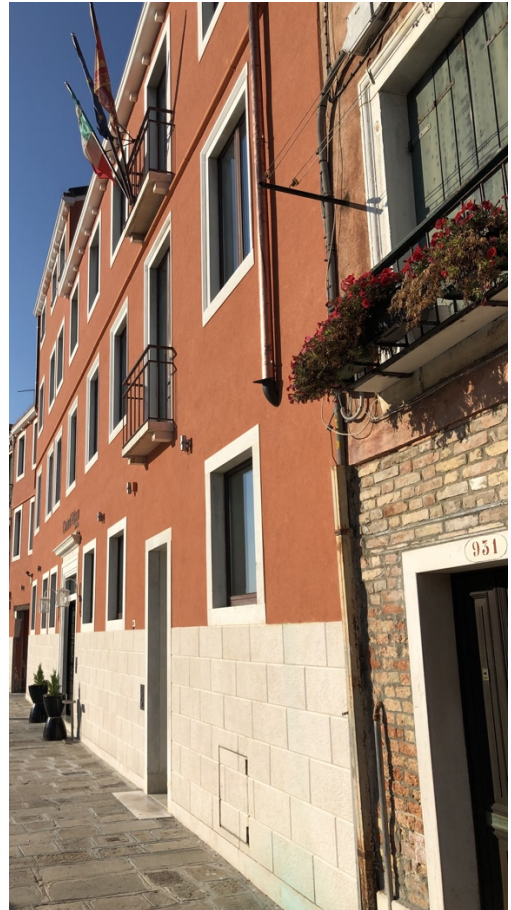
Carnival Palace Hotel a Venezia Con Nobilium®