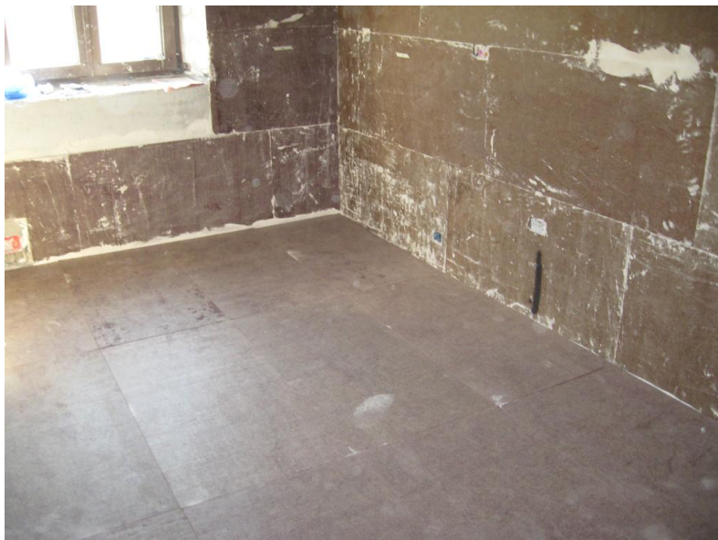
Posa senza uso dei tasselli