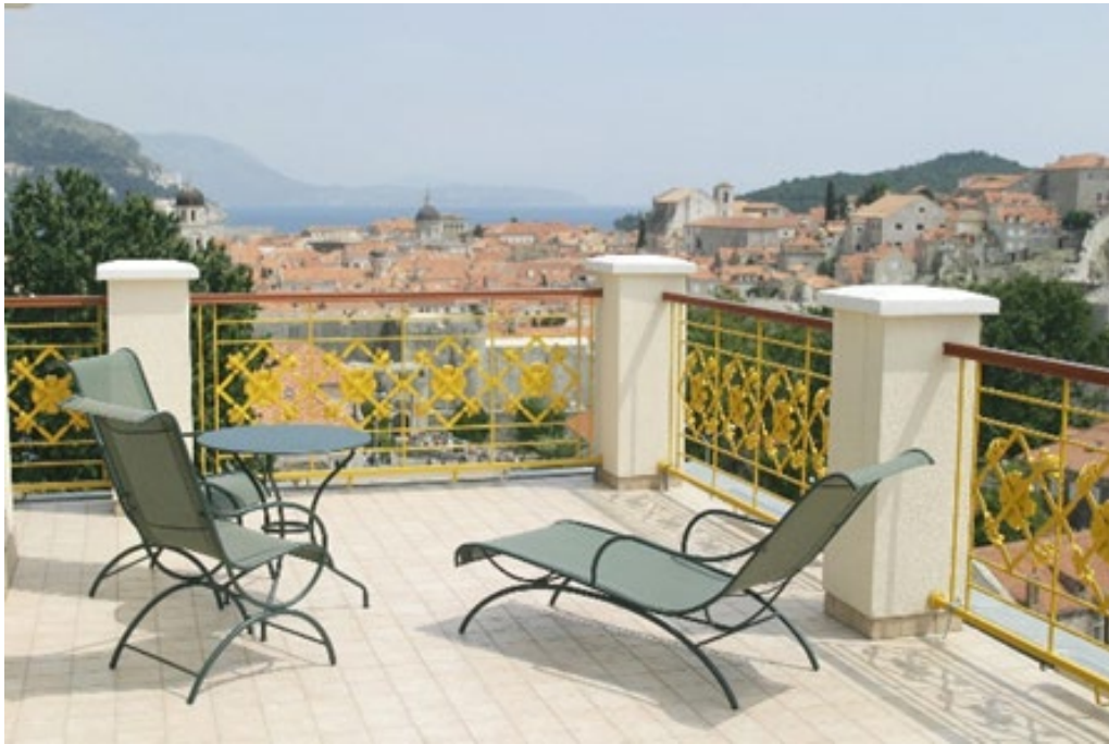
Referenza Hilton Imperial Dubrovnik - Terrace view

Con l'arrivo della bella stagione e delle temperature favorevoli, il desiderio di poter sfruttare e godere appieno di spazi privati all'aperto, come coperture, terrazzi e balconi, è sempre più preponderante.