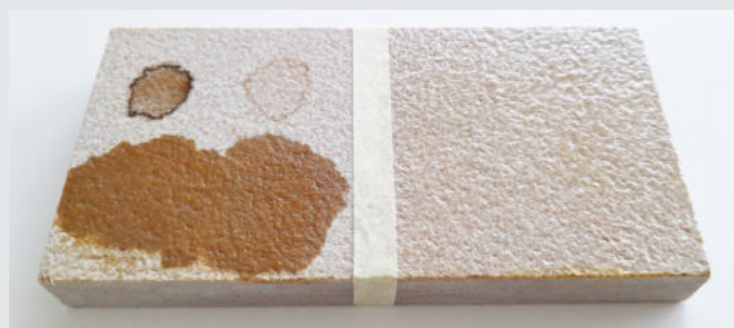
4 ORE 1 ORA