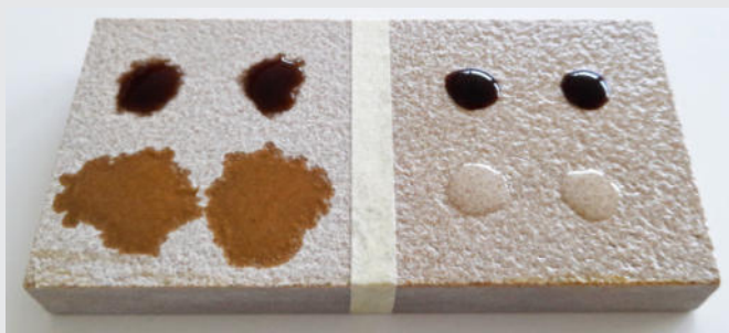
4 ORE 1 ORA