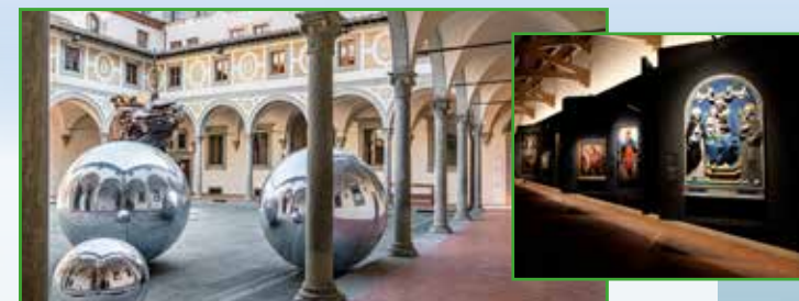
Museo degli Innocenti