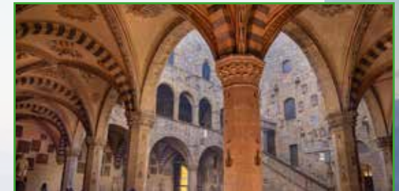
Museo del Bargello