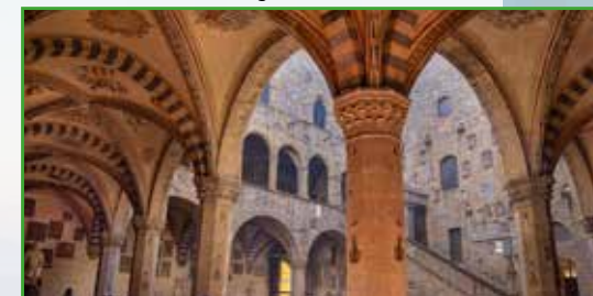
Museo del Bargello