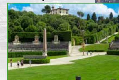
Giardini di Boboli