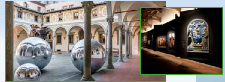
Museo degli Innocenti

12:30 Lunch at Lorenzo de' Medici, a typical restaurant in the centre of Florence