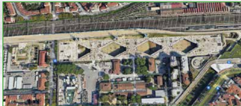
Cantiere nuova stazione AV di Firenze

N.B. We usually consider a maximum of 50 participants per single visit. Also, a week before the event we would need the list of participants and their shoe sizes. As we will give everyone safety shoes, helmets and RFI vests.